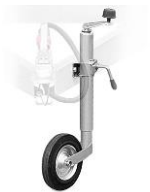
Koło manewrowe Hamulec najazdowy Obrysówka LED